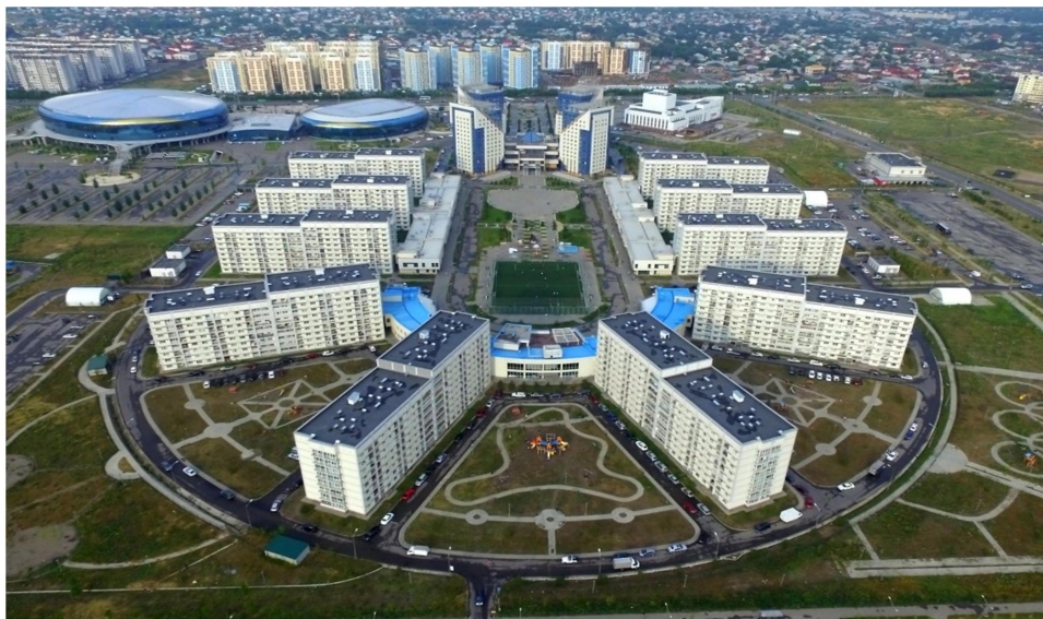
2-сурет. Athletic village тұрғын үй кешенінің сыртқы көрінісі