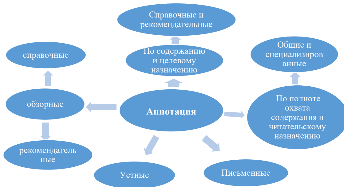
Рисунок 2 – Аннотация

Участники групп проводят комплексный анализ текста «Аннотация. Виды аннотаций», затем представляют его содержание в схеме (Рисунок 2).